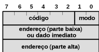
Fig. 2. Formato da Instrução do Processador Sapiens

As instruções em linguagem de máquina do processador Sapiens podem ter um, dois ou três bytes (8 bits), conforme pode ser visto na Figura 2. Nas instruções, o primeiro byte sempre contém o código de operação nos 6 bits mais significativos e, quando for o caso, o modo de endereçamento nos 2 bits menos significativos. As instruções com apenas um byte não tem outro operando além do acumulador, que é um operando implícito para quase todas as instruções. As instruções com dois bytes são aquelas que, além do acumulador, usam um dado imediato de 8 bits como operando no segundo byte da instrução.